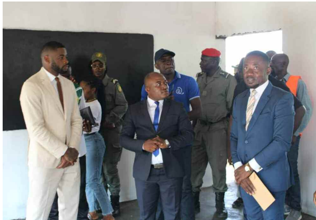
Nkenglikok le 29 juillet 2023. Alexandre Song procède à l'inauguration de deux salles de classe à l'école publique de sa contrée.

Tournoi Alexandre Song. C'est le prize money du vainqueur de la première édition de ce championnat qui a mobilisé de milliers de personnes samedi dernier au stade de Nkenglikok.