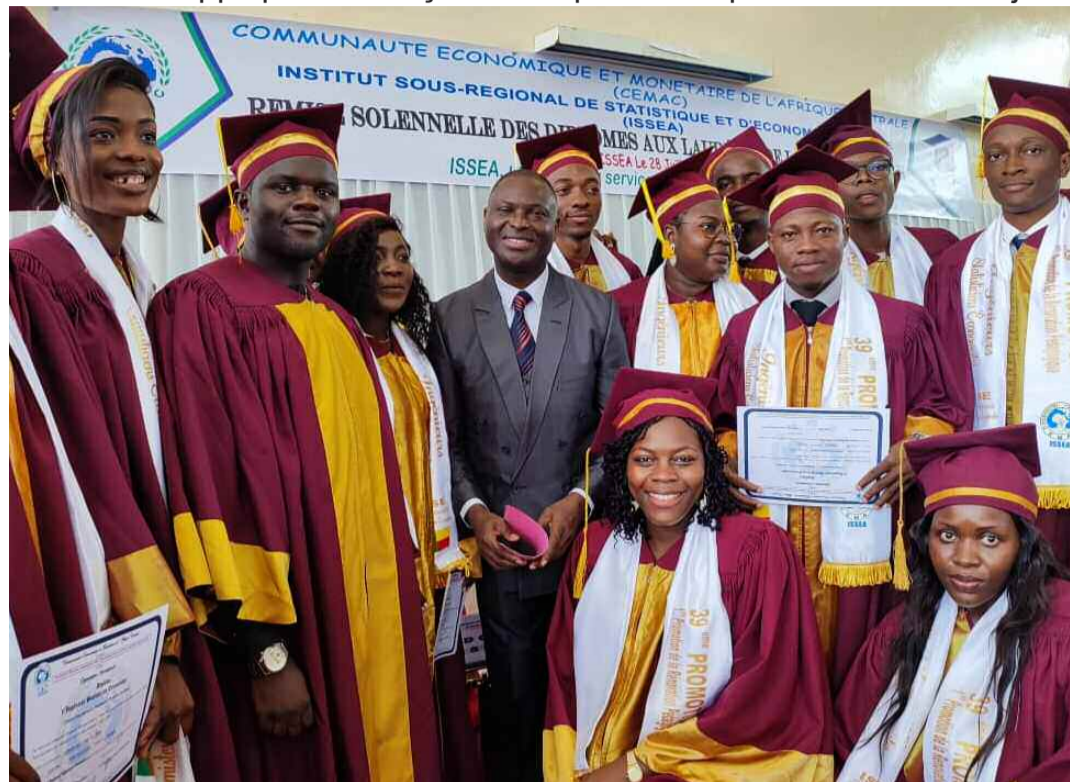
Yaoundé le 28 juillet 2023, remise des diplômes à l'Issea

Issea. 65 étudiants de cette institution spécialisée dans les domaines de la statistique et de l'économie appliquée ont reçu leurs diplômes et prix le vendredi 28 juillet 2023.