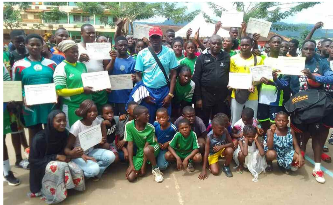
Eséka, le 29 juillet 2023 gare ferroviaire d'Eséka, fin du tournoi des académies

Cameroon Handball Academy. Au terme de la finale du tournoi d'évaluation des académies qui s'est achevé samedi dernier à l'esplanade du terrain de la gare ferroviaire d'Eséka.