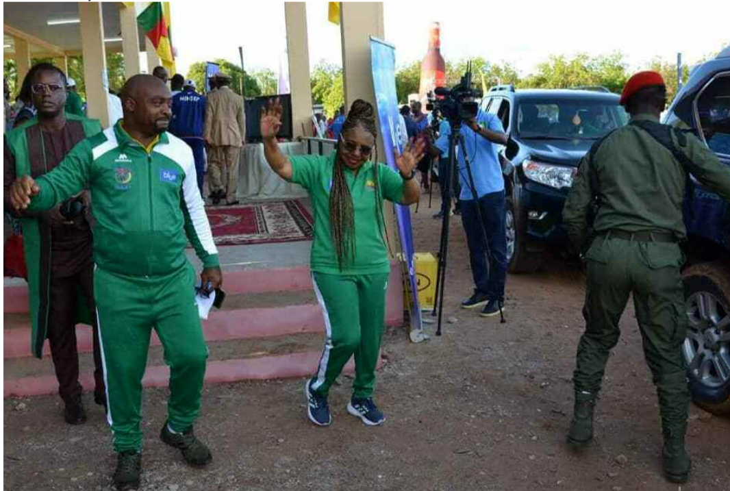
Garoua, le 29 juillet 2023. La ministre des Enseignements Secondaires, Pr Pauline Nalova Lyonga.

Garoua-Gaschiga. La 23ème édition du sport scolaire a connu un début festif samedi dernier avec la participation de Camtel, à travers sa marque ombrelle, Blue. La compétition ira du 29 au 05 août prochain.