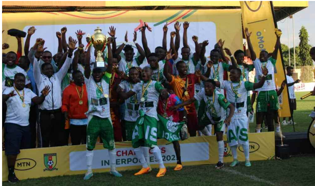
Yaoundé, le 30 juillet 2023. Isosha champion des interpoules 2023.

Interpoules 2023. Le représentant de la région du Sud-Ouest a battu Bafmeng United (2-0) hier, 30 juillet 2023 en finale au stade de Ngoa-Ekellé, succédant ainsi à Aigle royal du Moungo, tombeur de Victoria United lors de la précédente édition.