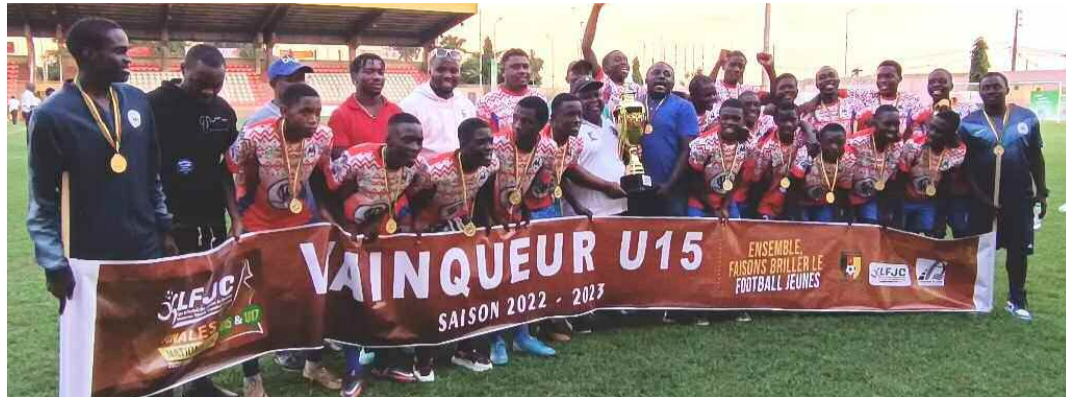
Yaoundé, le 29 juillet 2023. Stade de Ngoa-Ekellé. Espoir du Caire Champion du Cameroun U15

Football jeunes. L'équipe du centre de formation du quartier Carrière à Yaoundé, a battu Ajal de Maroua (2-1) lors de la finale du championnat national au stade de Ngoa-Ekellé, samedi dernier.