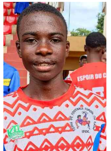
roua est une très bonne équipe. Elle joue bien.